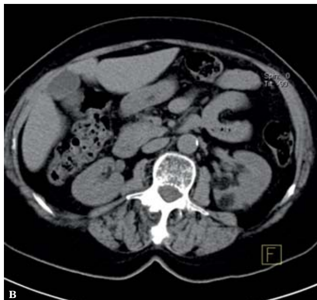
Ryc. 2 A, B. Angiomyolipoma nerki w obrazie TK Fig. 2 A, B. Renal angiomyolipoma in the CT image

W badaniu USG potwierdzono obecność drobnych kamieni w pęcherzyku żółciowym. Obraz prawej nerki był prawidłowy. W mięszu i zatoce lewej nerki uwidoczniono liczne, o równych zarysach, hiperechogeniczne zmiany ogniskowe o średnicy od 15 do 29 mm (ryc. 1 A, B). Wstępnie rozpoznano mnogie angiomyolipomata nerki. Pacjentkę skierowano na tomografię komputerową (TK) jamy brzusznej, która potwierdziła wstępną diagnozę (ryc. 2 A, B). W badaniu fizykalnym, w badaniach laboratoryjnych, na zdjęciu klatki piersiowej nie stwierdzono odchyłeń od stanu prawidłowego. Pacjentka pozostaje w ambulatoryjnej obserwacji.